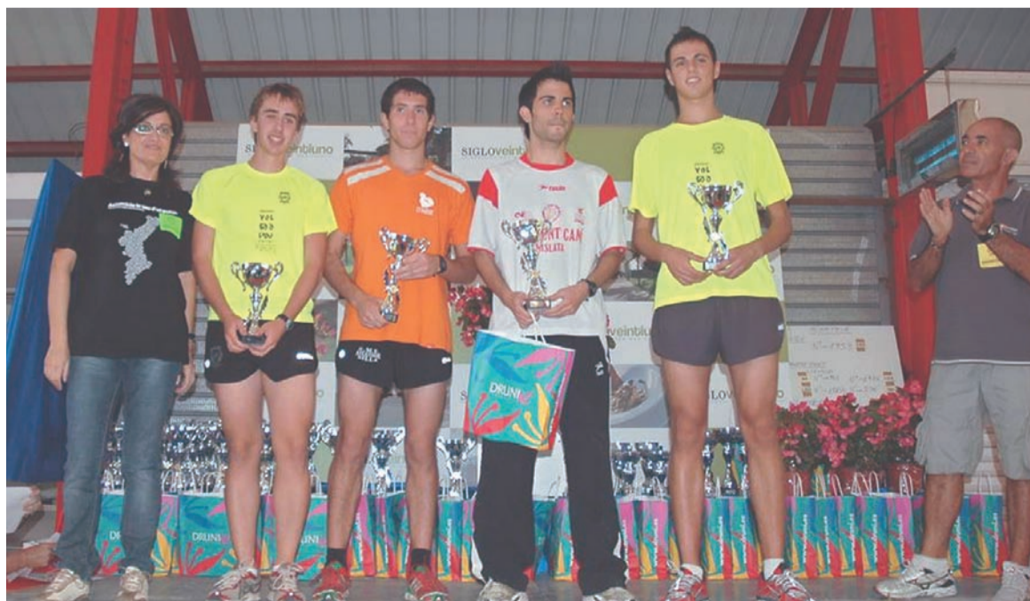
XVII Volta a peu Ciutat de Carlet 27/9/09