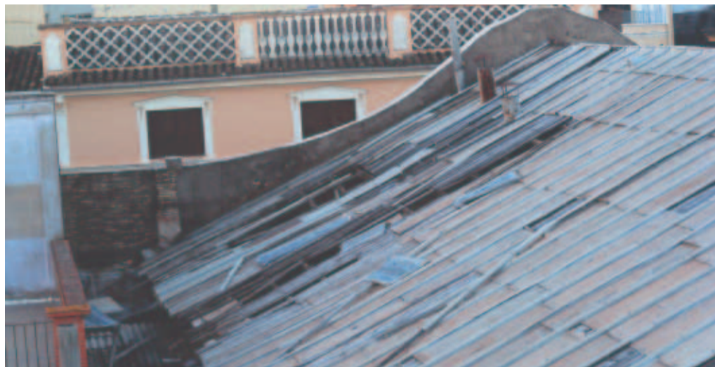
Estat actual del sostre del Siglo

anys, tornarem a tindre una partida simbòlica als pressupostos municipals per a una actuació que l'Ajuntament no mamprén mai" .