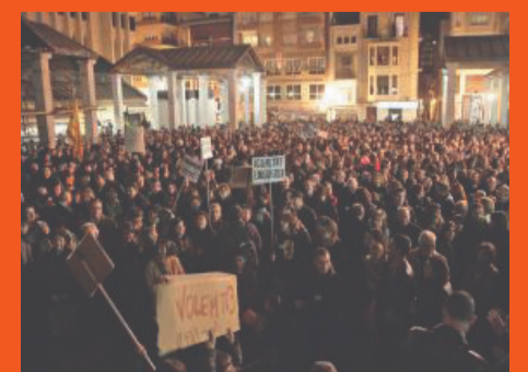
Milers de manifestants protesten per la supressió del canal públic.