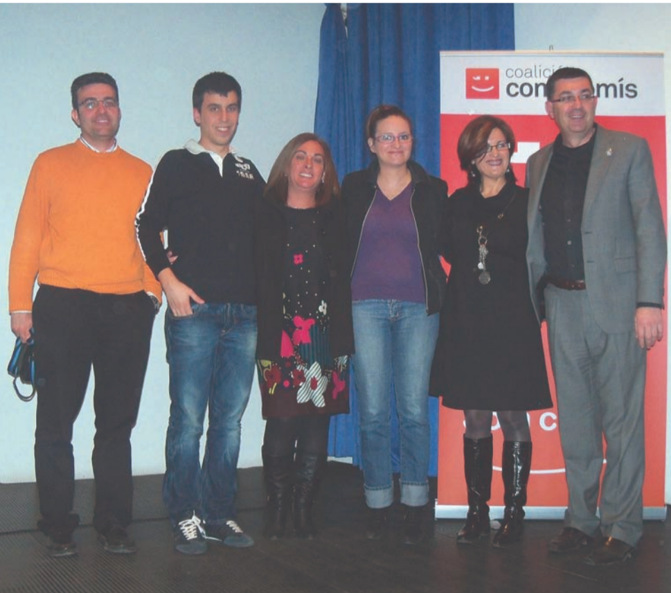
Els regidors del BLOC, amb els diputats Enric Morera i Mònica Oltra.