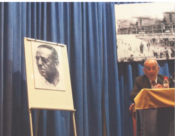
Els dos autors de l'obra, avi i net.